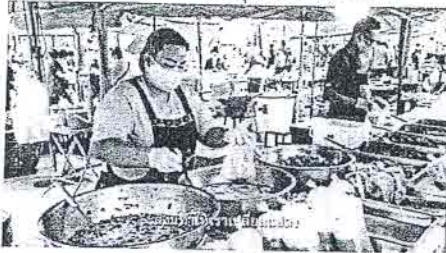
ข้อชุดที่ ๒ ทางรอด